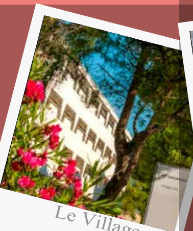
Le Village Club